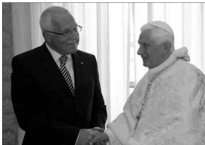
Papež Benedikt XVI. přijal ve Vatikánu prezidenta Klause a potvrdil návštěvu v Česku.