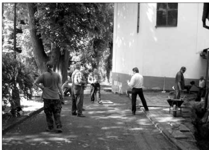
Brigáda před opravou fasády našeho kostela