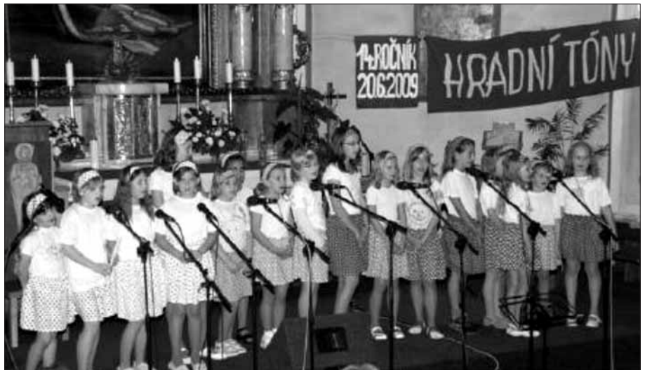
Zpívá naše scholka Slunička