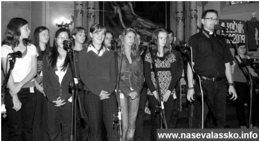
Starší schola před vystoupením

Další zvláštností letošního zápolení byla nejvyšší účast účinkujících za celou existenci soutěže. A navíc ještě účast profesionálů – skupina Tupá šídla z Lip-