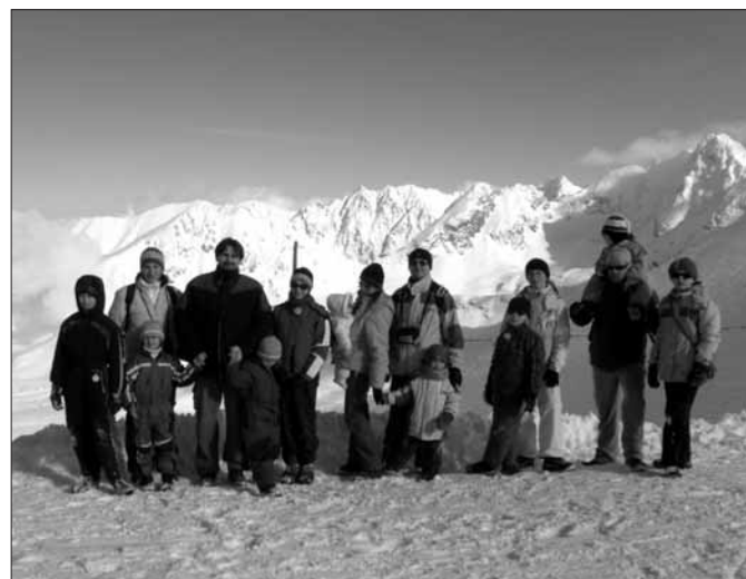
Společenství manželů v Zakopaném – fotografoval otec Karel.