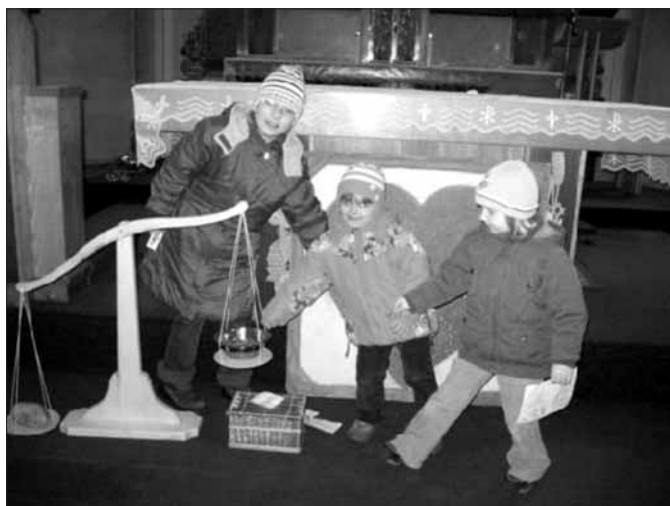
Modlitba, odříkání, dobré skutky... - děti se opravdu snažily.