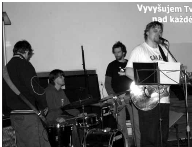
7.3.2009 Lamačské chvály v „Orlovně.“ Katecheze o víře se společenstvím z Bratislavy