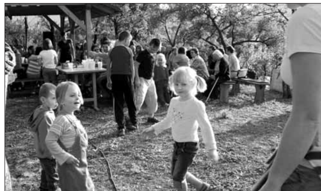
28.9. hodové posezení na farní zahradě