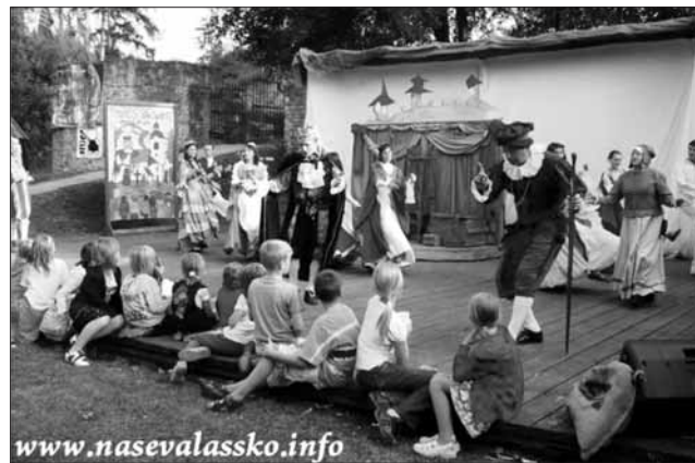
12.9. farní den na hradě v Brumov