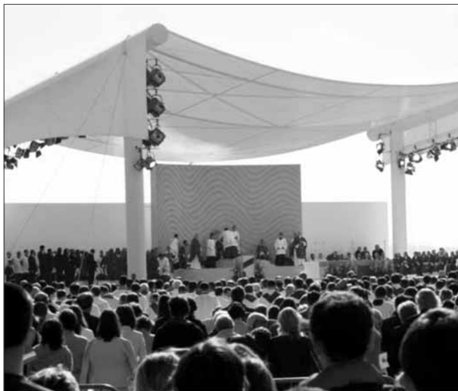
Svatý otec Benedikt XVI. v Brně - Tuřanech