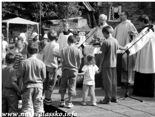
12. 9. farní den