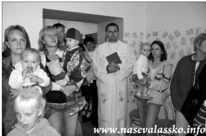
Z otvírání rodinného a mateřského centra „Malenka“

v Brumově-Bylnici zahájilo svoji činnost ve středu 30. září 2009. Toto centrum pro rodiče a jejich děti se nachází v budově bývalé Národní školy v Brumově, na ul. 1. května. Otevřeno bude každé úterý a čtvrtek od 8:00 do 12:00 hodin, první týden v říjnu vstup volný.