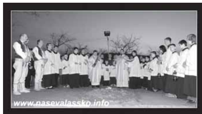
Z liturgie Bílé soboty – velikonoční vigilie